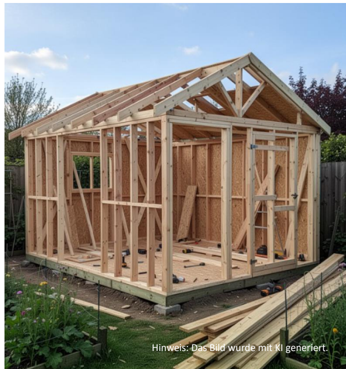
Hinweis: Das Bild wurde mit KI generiert.

Hochbeete sollten vorzugsweise aus Holz errichtet bzw. gekauft werden.