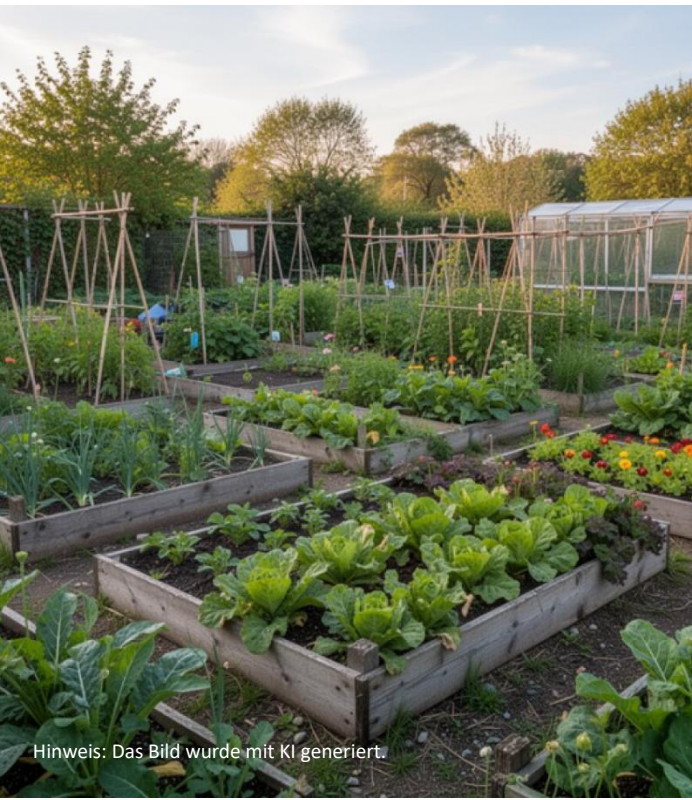
Hinweis: Das Bild wurde mit KI generiert.